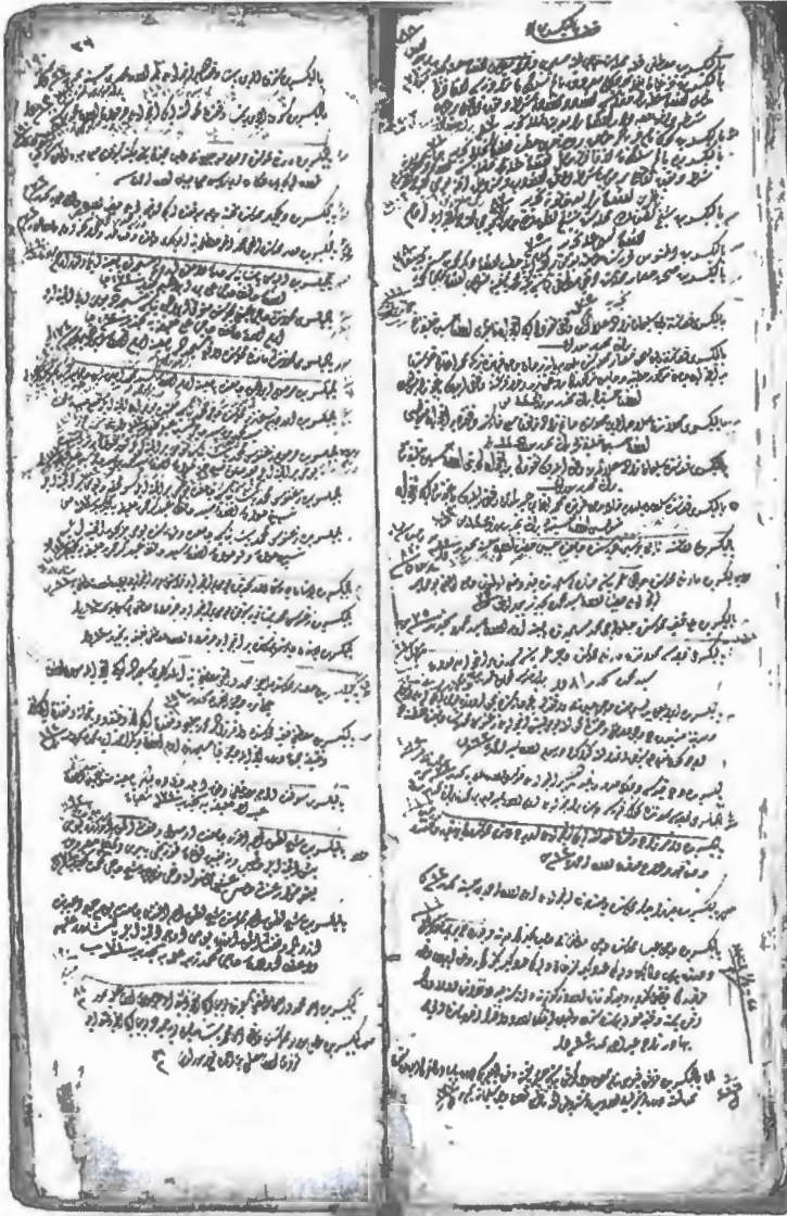
Defter no: 1158 . vr. 76.

Belge-3 VAD. no:1158 vr.36. Vakıflar Genel Müdürlüğü Arşivi 1158 numaralı Hurufat Defterleri'nin Balıkesir Kazası'na ait kayıtlarını ihtiva eden varak.